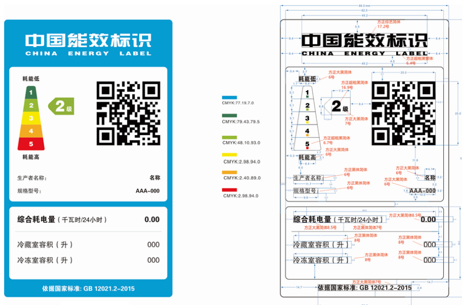
图：制作完成后效果