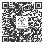
微信扫一扫 获取美食烩食谱

扫描右方二维码，关注“食色FM”公众号，进入电压力锅食谱专题；按照食谱准备好食材放入内锅，按产品上的“美食烩”键，并按手机端食谱指引设置入味时间，按“开始”键即可开始烹饪。