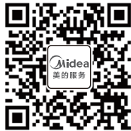
微信扫一扫, 服务立马到